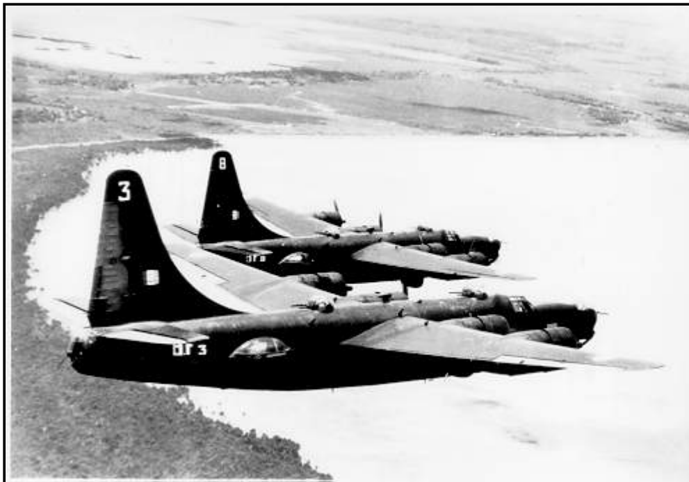
Navy 4-engine heavy bombers - equipped with Norden sights