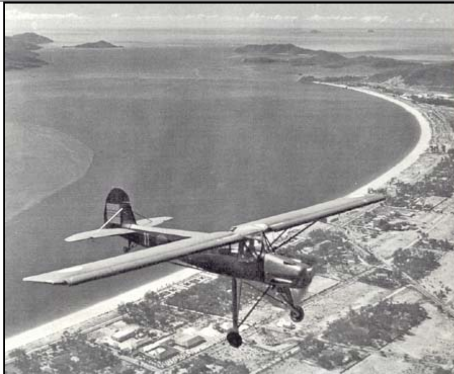
Morane 502 ("criquet") avion léger d'observation et de guidage, pour réglages de tirs etc (R. Vercken)