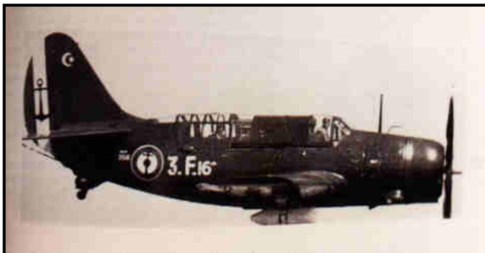
Torpillage et Bombardement en piqué