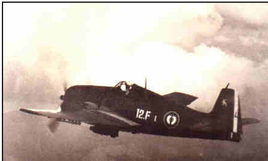
HELLCAT de la 12ème Flottille de Chasse embarquée "Opération ATLANTE" Extrait de "Au delà du pont d'envol" de Roger VERCKEN

..... Du 8 au 23 Juin inclus : opérations au Nord Vietnam au profit du GATAC Nord, la 11F embarquée sur l'ARROMANCHES.