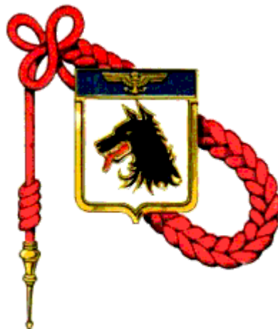
Insignia of the 28 F - Fourragère won in Indochina